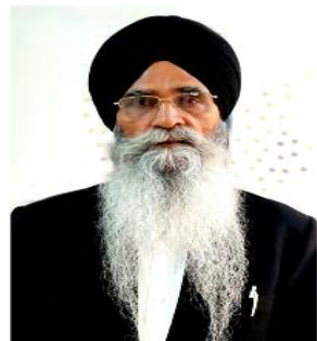
जो गंभीर आरोपों में सजा काट रहा है और सिख विरोधी धार्मिक

जैतो, 4 जनवरी : शिरोमणि गुरद्वारा प्रबंधक कमेटी के अध्यक्ष एडवोकेट हरजिंदर सिंह धामी ने गंभीर अपराधों के लिए सजा काट रहे डेरा सिरसा प्रमुख गुरमीत राम रहीम को एक बार फिर 40 दिन की पैरोल दिए जाने की कड़ी निंदा की है। एडवोकेट हरजिंदर सिंह धामी ने उस व्यक्ति के प्रति सरकार को इस उदारता की कड़ी आलोचना की है