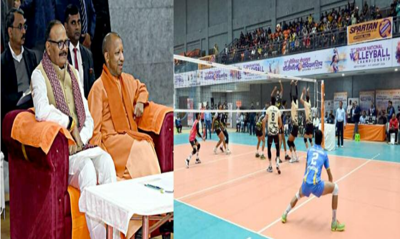
एमओयू का आदान-प्रदान हुआ। सीएम योगी ने काशी में आई सभी 58 टीमों (30 पुरुष, 28 महिला) के खिलाड़ियों, कोच व ऑफिशियल का स्वागत किया।

समाज जागरण वाराणसी, 4 जनवरी: मुख्यमंत्री योगी आदित्यनाथ ने कहा कि पिछले वर्षों में उत्तर प्रदेश और देश में खेल को नई दृष्टि, नए संसाधन और नया आत्मविश्वास मिला है। प्रधानमंत्री नरेंद्र मोदी के मार्गदर्शन में उभरते "न्यू स्पोर्ट्स कल्चर" ने युवाओं में अनुशासन, फिटनेस और टीम-स्प्रिट को मजबूत किया है। अब खेल सिर्फ शौक नहीं, बल्कि व्यक्तित्व विकास और राष्ट्र निर्माण का सशक्त माध्यम बन चुका है। उन्होंने कहा कि आधुनिक खेल इंफ्रास्ट्रक्चर, पारदर्शी चयन-प्रक्रिया और मिशन-मोड पर चल रही योजनाओं के चलते युवा खिलाड़ियों के लिए अवसर बढ़े हैं। ग्राम पंचायत से लेकर राष्ट्रीय स्तर तक प्रतियोगिताओं का विस्तार किया गया है। परिणामस्वरूप यूपी के खिलाड़ी अंतरराष्ट्रीय प्रतियोगिताओं में पहले से कई गुना अधिक भागीदारी और पदक ला रहे हैं।