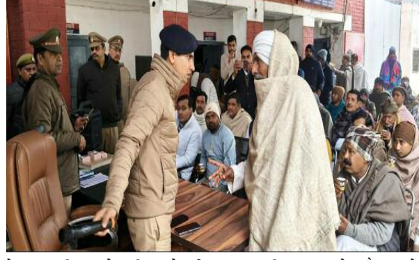
ने बताया कि उसके परिवार के ही एक व्यक्ति द्वारा उसे और उसके