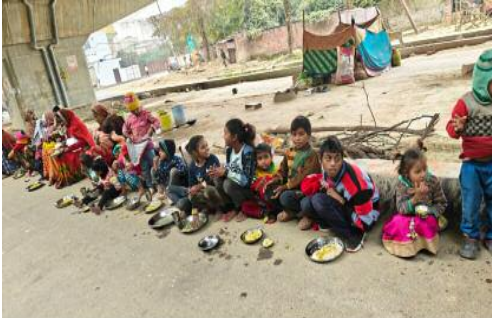
कार्यक्रम के अस्थायी आवासों और नगर निगम जोन-8 की मलिन बस्तियों सहित कई क्षेत्रों में किया गया। इस दौरान लगभग 1500 जरूरतमंदों को आलू-गोभी-मटर-टमाटर की सब्जी, चावल और सूजी का हलुवा परोसा गया।

समाज जागरण लखनऊ। नववर्ष के अवसर पर सेवा, संवेदना और सम्मान का सुंदर उद्घरण प्रस्तुत करते हुए इंडियन हेल्पलाइन सोसाइटी (रिज.) द्वारा संचालित सेवा प्रकल्प वृज की रसोई के अंतर्गत रविवार 4 जनवरी 2026 को आशियाना, लखनऊ में निःशुल्क भोजन वितरण एवं गर्म कपड़े-कंबल वितरण कार्यक्रम का आयोजन किया गया। यह कार्यक्रम प्रेरणास्रोत बाबा नीम करौली की कृपा से अमराहट 2 बजे प्रारंभ हुआ, जिसमें समाज के आर्थिक रूप से कमजोर, निराश्रित, असहाय बच्चों, बुजुर्गों, दिहाड़ी मजदूरों और श्रमिक परिवारों को सम्मानपूर्वक भोजन कराया गया।