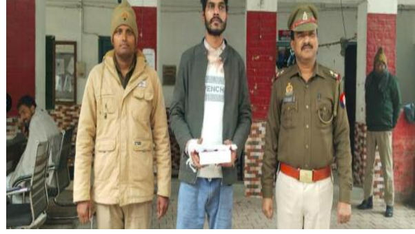
रोड पर स्थित उसके होटल पर दो जानलेवा हमला कर छह हजार रुपए व मोबाइल फोन लूटकर फरार हो