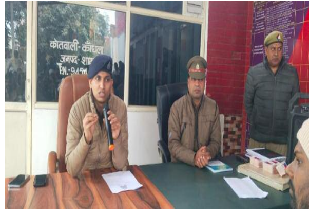
थोड़ी-सी लापरवाही भी बड़े हादसे का कारण बन सकती है। प्रत्येक