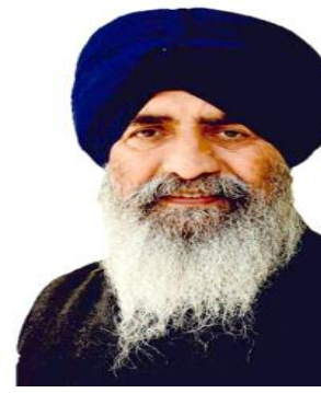
जा सकता। उन्होंने कहा कि बलतेज पन्नू का यह बयान कि 328 पवित्र

समाज जागरण, जैतो, 5 जनवरी (रघुनंदन पराशर)