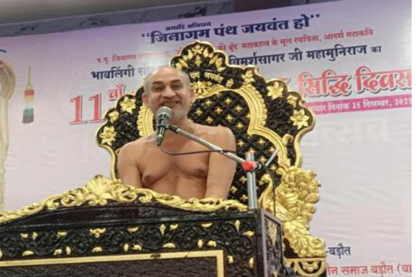
का साधन है। अन्त में कहा कि जन्म एवं मृत्यु का कोई मुहूर्त नहीं होता, उसी प्रकार संयम धारण करने का कोई मुहूर्त नहीं होता। जब आत्मोत्थान की भावना जाग्रत हो, संयम स्वीकार लेना चाहिए। संयम के बिना हमारा जीवन मरुस्थल की भांति है जहाँ सुख के एक नीर की बून्द भी नहीं है। इस संसार में भाग्यशाली वही है, जिसका मन पवित्र है, संयमी है, जिसने अपनी इन्द्रियों और कषाय को