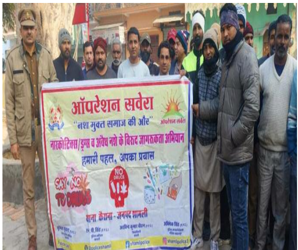
रहना अत्यंत आवश्यक है। नशा व्यक्ति के शारीरिक एवं मानसिक