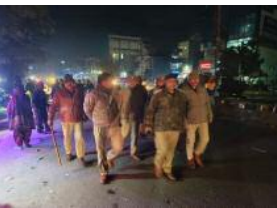
गौतमबुद्धनगर, 13 जनवरी 2026। नोएडा के सेक्टर-22 (चौड़ा क्षेत्र) में विद्युत पोलों पर फैले इंटरनेट तारों के बेतरतीब जाल को लेकर विद्युत विभाग ने कड़ा रुख अपना लिया है। क्षेत्र की सुरक्षा और सुव्यवस्था से खिलावाड़ करने वाली इंटरनेट सेवा प्रदाता कंपनियों पर अब कार्रवाई की तलाश लटक गई है।

नोएडा। पुलिस आयुक्त नोएडा के निर्देशन तथा पुलिस उपायुक्त सेंट्रल नोएडा के पर्यवेक्षण में सहायक पुलिस आयुक्त (क्षेत्र-3) सेंट्रल नोएडा द्वारा पुलिस बल के साथ थाना सूरजपुर क्षेत्र अंतर्गत बाजारों एवं अन्य भीड़-भाड़ वाले स्थानों पर पैदल गश्त की गई। गश्त के दौरान क्षेत्र की सुरक्षा व्यवस्था एवं यातायात व्यवस्था का गहन निरीक्षण किया गया तथा संबंधित अधिकारियों और कर्मचारियों को आवश्यक दिशानिर्देश दिए गए। पुलिस द्वारा आम नागरिकों से संवाद स्थापित कर उन्हें सुरक्षा का भरपूर दिलाया गया और किसी भी संदिग्ध गतिविधि की सूचना तत्काल पुलिस को देने की अपील की गई। पुलिस प्रशासन ने स्पष्ट किया कि कानून-व्यवस्था बनाए रखने एवं अपराधों पर प्रभावी नियंत्रण हेतु इस प्रकार की पैदल गश्त आगे भी नियमित रूप से जारी रहेगी।