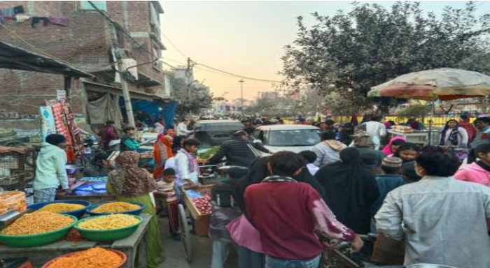
जाम में फंस जाते हैं, जिससे स्कूली बच्चे, नौकरीपेशा लोग और आपातकालीन सेवाएं भी प्रभावित होती हैं।

बाजार के दौरान दिल्ली-सहारनपुर मार्ग पर भारी भीड़ उमड़ती है, जिससे घंटों तक जाम की स्थिति बनी रहती है। इस मार्ग से गुजरने वाले सैकड़ों वाहन चालक