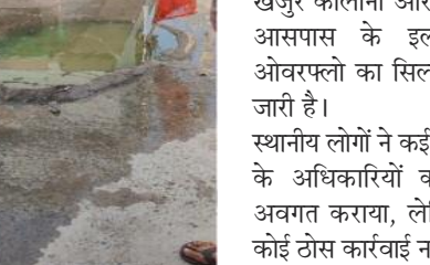
ग्रामीणों का कहना है कि इस वजह से गंदगी और बदबू फैलती है, बच्चे और निवासी बीमार रहने लगे हैं।

नोएडा, 13 जनवरी 2026। सदरपुर गांव और सेक्टर 45 कॉलोनी में निवासी आईपीएस 4 सीवर लाइन की खराब स्थिति से काफी परेशान हैं। नोएडा प्राधिकरण द्वारा करोड़ों की लागत से बनाई गई यह सीवर लाइन आए दिन खराब रहती है या बंद रहती है, जिससे गांव और कॉलोनी में सीवर का पानी घरों और गलियों में भर जाता है।