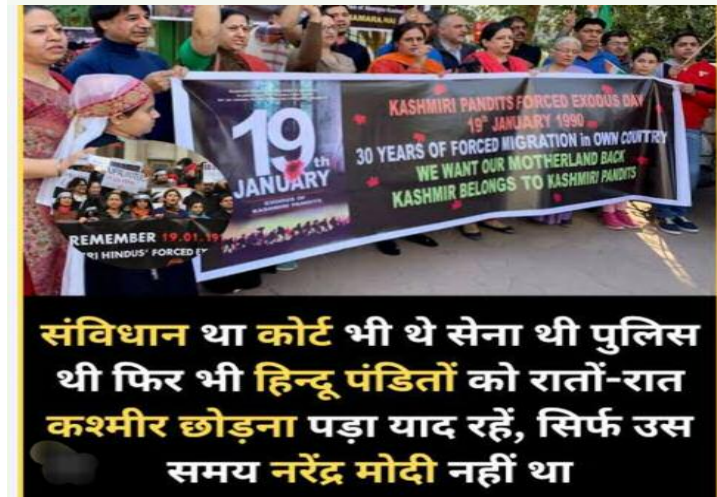
संविधान था कोर्ट भी थे सेना थी पुलिस थी फिर भी हिन्दू पंडितों को रातों-रात कश्मीर छोड़ना पड़ा याद रहें, सिर्फ उस समय नरेंद्र मोदी नहीं था

काकाजी, हम मूर्ख हिंदू इतिहास से कभी सबक नहीं लेते और तुरंत भूल जाते हैं। कश्मीर में सिर्फ पंडितों का नहीं बल्कि हर जाति के हिंदुओं की हत्या और बलात्कार हुआ था लेकिन ये कांग्रेसी