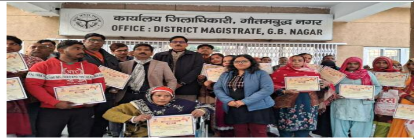
लाभार्थियों का वितरण विवरण

गौतम बुद्ध नगर, 18 जनवरी, 2026 - प्रधानमंत्री आवास योजना-शहरी 2.0 के तहत गौतम बुद्ध नगर के 199 लाभार्थियों को आवास निर्माण के लिए प्रथम किस्त के रूप में 1,00,000 प्रत्यक्ष अंतरण किया गया। इस कार्यक्रम की अध्यक्षता विधायक जेवर धीरेन्द्र सिंह ने की, जबकि इसका सजीव प्रसारण मुख्यमंत्री योगी आदित्यनाथ की अध्यक्षता में लखनऊ से हुआ।