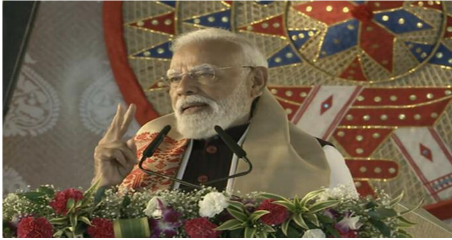
काजीरंगा एलिवेटेड कॉरिडोर प्रोजेक्ट के भूमि पूजन और दो नई अमृत भारत एक्सप्रेस ट्रेनों को

(समाज जागरण) असम, 18 जनवरी- प्रधानमंत्री नरेंद्र मोदी ने कांग्रेस पर आरोप लगाया कि उसने अपने सियासी फायदे के लिए असम में अस्थिरता पैदा की और राज्य को हिंसा की आग में धकेला। उन्होंने कहा कि कांग्रेस ने स्वतंत्रता के बाद असम की समस्याओं को हल करने के बजाय घुसपैठियों को बढ़ावा देकर अपने वोट बैंक मजबूत किया और असम की जमीन पर कब्जा होने दिया। पीएम मोदी यह बातें असम में