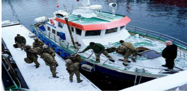
के रूप में देखा जा रहा है, लेकिन जहां जर्मनी ने सामरिक संयम

जेट्स भी उतार दिए हैं। एबीसी न्यूज के मुताबिक, जर्मनी की सेना ने ग्रीनलैंड से अपनी 'टोही टीम' को वापस बुलाना शुरू कर दिया है। रिपोर्ट है कि 15 जर्मन सैनिक एक सिविलियन फ्लाइट से कोपेनहेगन के लिए रवाना हो रहे हैं। इसे अमेरिकी राष्ट्रपति डोनाल्ड ट्रंप के भारी दबाव और धमकी के सीधे असर