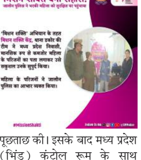
मिशन शक्ति बना सहारा: महिला को सुरक्षित घर पहुंचाया

जालौन/डकोर, 18 जनवरी, 2026 - जनपद जालौन के डकोर क्षेत्र में मिशन शक्ति टीम के नियमित भ्रमण के दौरान एक महिला को सदिग्ध अवस्था में भटकते हुए पाया गया। महिला अपना नाम और पता स्पष्ट रूप से नहीं बता पा रही थी। पुलिस ने महिला को थाना डकोर स्थित मिशन शक्ति केंद्र में सुरक्षित लाया और संवेदनशीलता के साथ