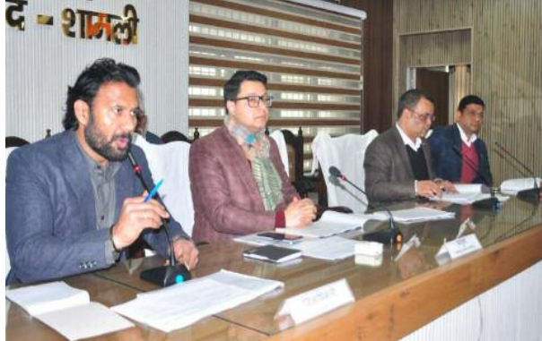
छात्र-छात्राएं जिनकी आयु 01 जनवरी 2026 को 18 वर्ष पूर्ण हो चुकी है, उनका फॉर्म-6 भरवाकर मतदाता सूची में नाम दर्ज कराया