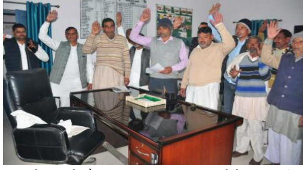
प्रत्याशियों का आरोप है कि नामांकन पत्र दाखिल करने के लिए निर्धारित

समाज जागरण शामली। (फुरकान जंग )उत्तर प्रदेश सहकारी ग्राम विकास बैंक लिमिटेड, लखनऊ की शाखा प्रतिनिधि एवं प्रबंध कमेटी के निर्वाचन को लेकर शामली विकास खंड में चल रही चुनाव प्रक्रिया उस समय विवादों में घिर गई, जब नामांकन के अंतिम दिन प्रत्याशियों ने चुनाव अधिकारी के गायब रहने का आरोप लगाते हुए हंगामा व प्रदर्शन किया।