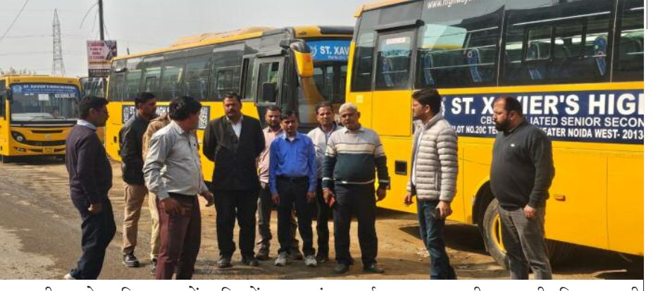
साथ ही, प्रत्येक विद्यालय में 'विद्यालय परिवहन सुरक्षा समिति' का गठन अनिवार्य किया गया है, जिसकी मासिक बैठकें आयोजित कर उनके निर्णयों का पालन करना होगा। परिवहन विभाग ने स्पष्ट किया कि

विद्यालय वाहनों के लिए प्रबंधक/प्रधानाचार्य की पूर्ण जिम्मेदारी होगी। परिवहन नियमों के अंतर्गत सभी वाहनों में निम्नलिखित अनिवार्य हैं: वैध परमिट, फिटनेस, बीमा और पीयूसी चालक का वैध ड्राइविंग लाइसेंस, पुलिस सत्यापन, स्वास्थ्य परीक्षण और प्रशिक्षण जीपीएस, सीसीटीवी कैमरे, फायर एक्सटिंग्विशर और फर्स्ट एड बॉक्स सीट बेल्ट और आपातकालीन निकास छात्राओं की सुरक्षा के लिए महिला परिचालक की तैनाती