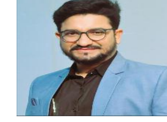
लेखक - डॉ. प्रितम भि. गोडाम

देश में लगातार बढ़ती आर्थिक विषमता समाज में एक बड़ी खाई का निर्माण कर रही है, इससे विकास कार्य में बाधाएं