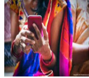
"भीम ऐप कम इंटरनेट वाले क्षेत्रों में भी सुरक्षित और सुलभ डिजिटल भुगतान सुनिश्चित करता है।" सीईओ (ललिता नटराज)

मासिक लेनदेन में 2025 में 300% वृद्धि पीयर-टू-पीयर भुगतान का हिस्सा: 28% किराना खरीदारी में हिस्सा: 18% फास्ट फूड आउटलेट्स: 7% अन्य: भोजनालय 6%, दूरसंचार 4%, सर्विस स्टेशन 3%, ऑनलाइन मार्केटप्लेस 2% सरल इंटरफेस और केशलेस से लोकप्रियता में तेजी