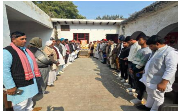
कार्यक्रम के आरंभ में पार्टी पदाधि कारियों और कार्य कर्ताओं ने जनेश्वर मिश्र के चित्र पर पुष्पांजलि अर्पित कर उन्हें श्रद्धासुगम अर्पित

रालोद छोड़कर बड़ी संख्या में लोगों ने ली समाजवादी पार्टी सदस्यता