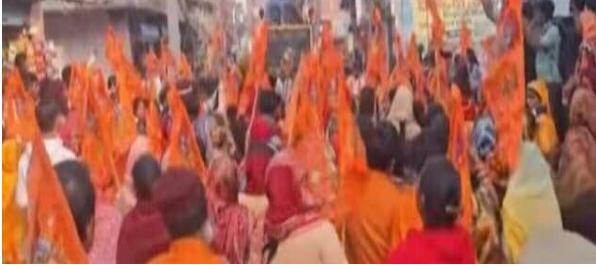
हाथों में भगवा ध्वज के साथ आस्था वानो के मुख से गूंज रहे गगन चुंबी श्री राम के जयकारों के दौरान ऐसा प्रतीत हो रहा था

समाज जागरण लोनी, 22 जनवरी: श्री राम प्राण प्रतिष्ठा की दूसरी वर्ष गांठ पर गुरुवार को लोनी में भव्य शोभा यात्रा का आयोजन हुआ। इस दौरान बड़ी संख्या में शामिल महिला व पुरुषों के बीच श्री राम नाम के जयकारे गूंजते रहे। बैंड-बाजे व धार्मिक संगीत के साथ निकाली गई यात्रा में हजारों की संख्या में शामिल पुरुषों एवं मातृशक्ति ने भागीदारी निभाई।