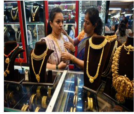
सोने का दाम 1,13,346 रुपए प्रति 10 ग्राम हो गया।

नई दिल्ली, 22 जनवरी 2026: सोना और चांदी खरीदारों के लिए राहत भरी खबर है। गुरुवार को वैश्विक अस्थिरता में कमी आने के कारण सोने और चांदी की कीमतों में तेज गिरावट देखी गई। इंडिया बुलियन ज्वेलर्स एसोसिएशन (आईबीजे) के अनुसार, चांदी का दाम 19,386 रुपए घटकर 2,99,711 रुपए प्रति किलो हो गया है, जबकि पहले यह 3,19,097 रुपए प्रति किलो था।