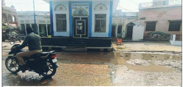
बहल कस्बे में टूटी पड़ी सड़क मार्ग का दृश्य, सड़क मार्ग पर बने गड़ों से बहता गंदा पानी।

बहल, 22 जनवरी। पिछले 15 वर्षों से 50 मीटर सड़क के एक टुकड़े के हालात सुधारने व सुधरवाने की जरूरत नहीं समझी गई तो बहल के विकास की कल्पना सरकार व पंचायत से करना बेमानी सा लगता है। सड़क के इस छोटे से टुकड़े के हालात बंद से बदतर होते चले आए यहां वीवीआईपी व प्रशासन के आला अधिकारी का आवागमन के बावजूद भी हालात यथावत बने रहे तो सुधार की गुंजाइश कम ही लगती है। हालात ये बने हैं कि कस्बे के मुक्तिधाम में शवयात्रा ले जाने के लिए गड़ों से