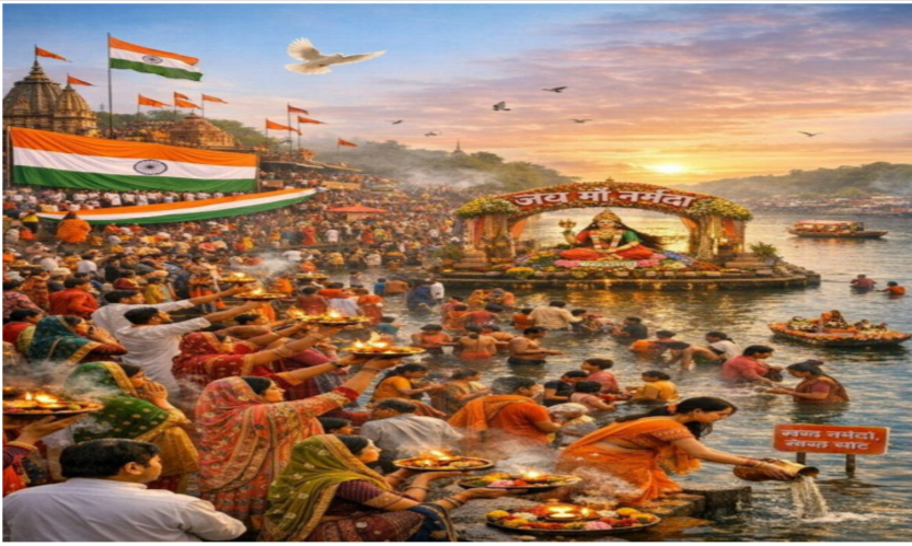
मां नर्मदा का यह पर्व सिर्फ आस्था का प्रतीक नहीं है, बल्कि पर्यावरण और स्वच्छता के प्रति जिम्मेदारी का भी संदेश देता है। श्रद्धालु न केवल पूजा अर्चना करते हैं, बल्कि संकल्प भी लेते हैं कि वे नदी और घाटों को हमेशा स्वच्छ बनाए रखेंगे।

समाज जागरण नरसिंहपुर (मध्य प्रदेश): मध्य प्रदेश की जीवनधारा कहे जाने वाली नर्मदा की जयंती पर रविवार को श्रद्धालुओं का अद्भुत सैलाब उमड़ा। नरसिंहपुर जिले से बहती यह पवित्र नदी न केवल क्षेत्र की उर्वरा भूमि को समृद्ध बनाती है, बल्कि पूरे प्रदेश के लोगों की जीवनधारा भी इससे जुड़ी है। अवतरण दिवस के अवसर पर भक्तों ने पदयात्रा और शोभायात्राओं के माध्यम से मां नर्मदा के प्रति अपनी आस्था प्रकट की। नरसिंहपुर के सतधारा समेत सभी घाटों पर भक्तों की भीड़ देखने लायक थी। इस अवसर पर गणतंत्र दिवस की झलक भी देखने को मिली, जब स्कूली छात्र-छात्राओं ने तिरंगे की चूनर मां नर्मदा को अर्पित की।