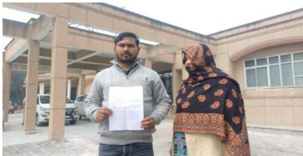
के अनुसार उनके पति ग्राम गौना में ग्राम प्रधान पद के दावेदार हैं। इसी कारण गांव के कुछ लोग उनसे रंजित रहते हैं। महिला का आरोप

ग्राम प्रधान पद की दावेदारी को लेकर झूठे आरोप और धमकी देने का मामला