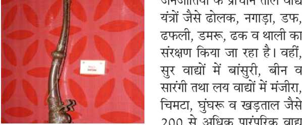
चेरो व माहीगीर जैसी जनजातियों के लोकजीवन में संगीत की

उत्तर प्रदेश के गोंड, थारू, बुक्सा, खरवार, सहरिया, बैगा, अगरिया,