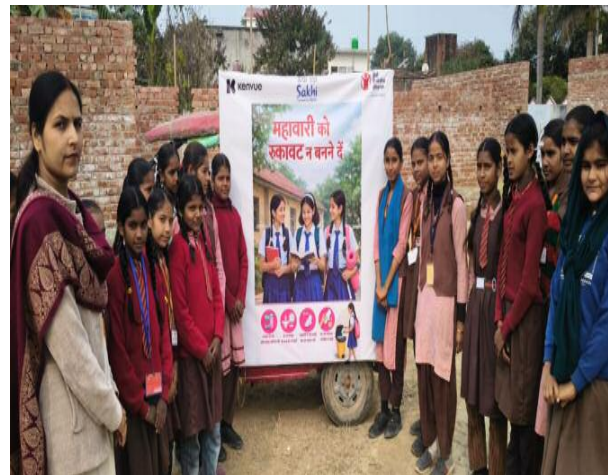
जागरूकता अभियान के दौरान गोण्डा, बहराइच, बलरामपुर, श्रावस्ती और बाराबंकी के शहर, ब्लॉक व सैकड़ों गांव संदेश दिया।'सखी' (Sakhi) पहल का लक्ष्य किशोरियों को सशक्त बनाना है ताकि वे स्वास्थ्य चुनौतियों और सामाजिक बाधाओं को पार कर अपनी शिक्षा पूरी कर सकें। इस अभियान के

जनपद श्रावस्ती "बाल रक्षा भारत संस्था द्वारा संचालित 'सखी: इनि शिफ्टिड टू सिक्चर हर फ्यूचर' कार्यक्रम के तहत आज उत्तर प्रदेश के पांच जनपदों-गोण्डा, बहराइच, बलरामपुर, श्रावस्ती और बाराबंकी में तीन दिवसीय ई-रिक्शा जागरूकता अभियान का सफल समापन हो रहा है। 23 जनवरी से शुरू हुए इस अभियान का मुख्य उद्देश्य ग्रामीण और शहरी समुदायों के बीच माहवारी स्वच्छता (Menstrual Hygiene) और बालिका शिक्षा के प्रति संवेदनशीलता बढ़ाना है माहवारी से जुड़ी वर्जनाएं और जानकारी का अज्ञात अक्सर बालिकाओं की शिक्षा में बाधक बनता है। इन तीन दिनों में ई-रिक्शा ने विभिन्न गांवों और मोल्लों का भ्रमण कर अभिभावकों और किशोरियों को यह संदेश दिया है कि सुरक्षित माहवारी प्रबंधन और निरंतर शिक्षा ही बालिकाओं के उज्ज्वल भविष्य की नींव है।"इस