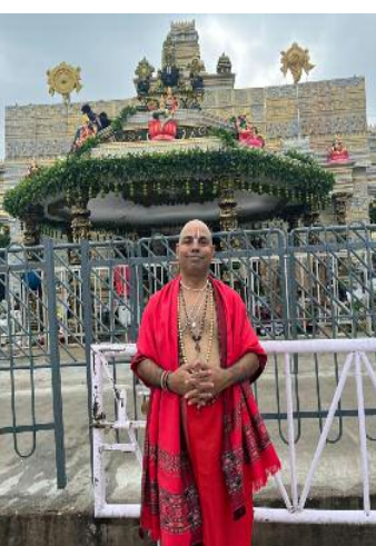
यहीं सबसे पहले साँस लेती है।

दूसरे को स्थायी अपराधी घोषित करने की। 2. अनुच्छेद 15 और 16 :- सकारात्मक भेदभाव बनाम नकारात्मक बहिष्कार संविधान सामाजिक पिछड़ेपन को ध्यान में रखते हुए सकारात्मक भेदभाव की अनुमति देता है, परंतु इसका उद्देश्य संतुलन स्थापित करना है, न कि किसी अन्य वर्ग को नीतिगत रूप से हाशिए पर धकेलना। यदि किसी कानून का प्रभाव यह हो कि विशेषकर सवर्ण समाज को संस्थागत रूप से तिरस्कृत किया जाए, तो यह सामाजिक न्याय नहीं बल्कि नया भेदभाव बन जाता है—जो संविधान की भावना के विरुद्ध है। 3. अनुच्छेद 19(1)(a) : अभिव्यक्ति की स्वतंत्रता और विश्वविद्यालयों की भूमिका कॉलेज और विश्वविद्यालय किसी भी राष्ट्र की बौद्धिक प्रयोगशालाएँ होते हैं। अनुच्छेद 19(1)(a) द्वारा प्रदत्त फ्रीडम ऑफ़ स्पीच एण्ड एक्सप्रेशन