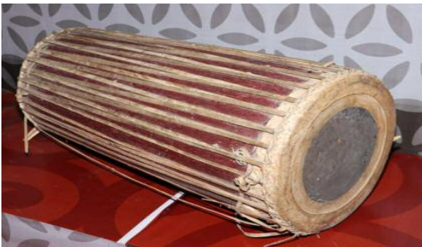
वाले जनजातीय कलाकारों को भी मंच मिल रहा है।

लखनऊ, 28 जनवरी। प्रदेश के जंगलों, पहाड़ों और नदियों के किनारे गुंजने वाली जनजातीय वाद्य यंत्रों की धुनें आज आधुनिक संगीत की चकाचौंध में खोती जा रही हैं। लेकिन, उत्तर प्रदेश का लोक एवं जनजातीय संस्कृति संस्थान इन धुनों को फिर से जीवंत करने की दिशा में लगातार प्रयास कर रहा है। जनजातीय सांस्कृतिक धरोहर को संभालने के उद्देश्य से संस्थान देश व प्रदेश की जनजातियों के 200