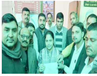
लेने की मांग की। उनका कहना था कि यह बिल उच्च वर्ग के छात्रों के