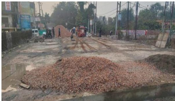
नहर पुल की चौड़ाई कम होने के कारण योजना जाम की समस्या रहती थी यहां आए दिन बड़े वाहनों के

बड़ौत। वाहनों के लिए पूर्वी यमुना नहर पुल का निर्माण फरवरी तक पूरा हो जाएगा जिस पर आवागमन भी शुरू हो जाएगा। नगर के कोताना रोड पूर्वी यमुना नहर पर बनाए जा रहे पुल का निर्माण लगभग पूरा हो चुका है। फरवरी माह में पुल से वाहनों का आवागमन शुरू होने की उम्मीद है। इससे लगभग 50 गांव जुड़े हुए हैं। इस पुल के निर्माण से इन गांवों के लोगों को आवागमन में सुचारु रूप से अच्छी सुविधा मिलेगी। पूर्वी यमुना