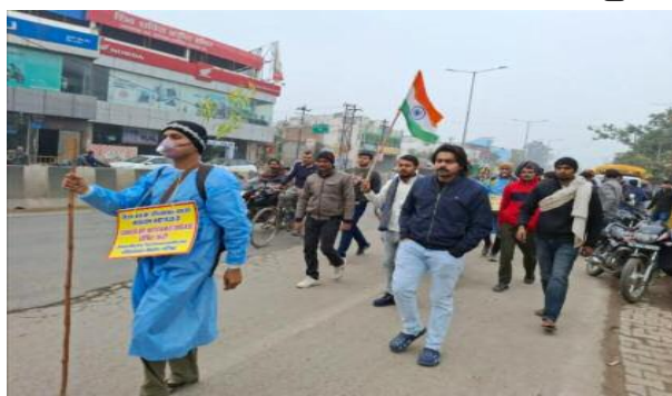
काली धमोला, कृष्णा नदी का पुनरुद्धार व पश्चिमी उत्तर प्रदेश में एम्स या पीजी की स्थापना तथा कैन्सर हॉस्पिटल की मांग को लेकर की जा