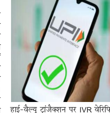
हाई-वैल्यू ट्रांज़ैक्शन पर IVR वेरिफिकेशन

नई दिल्ली। यूनिफाइड पेमेंट्स इंटरफेस से जैसे ही आप बड़ी रकम ट्रांसफर करने जाते हैं, अचानक मोबाइल पर एक कॉल आ जाती है और कई लोग सोच में पड़ जाते हैं कि अब क्या हो गया? कहीं पेमेंट अटक तो नहीं जाएगा? दरअसल यह कॉल किसी तकनीकी गड़बड़ी का नहीं, बल्कि आपकी कमाई को सुरक्षित रखने की कोशिश का हिस्सा है। UPI के रिकॉर्ड तोड़ इस्तेमाल के बीच बढ़ते ऑनलाइन फ्रॉड को रोकने के लिए बैंक अब