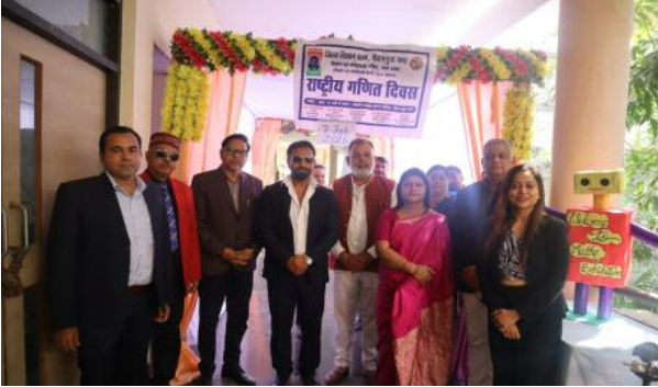
निर्णायक मंडल ने विद्यार्थियों द्वारा प्रस्तुत गणितीय मॉडलों का अवलोकन किया। निर्णायक समिति में जी.एन.आई.ओ.टी. के प्रोफेसर डॉ.