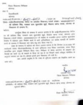
जबकि शिकायत घंटिया निर्माण सामग्री के इस्तेमाल दो नंबर का ईट

थी जिसका संदर्भ संख्या 4002 0026001217 है जिसकी जांच के लिए जिला विद्यालय निरीक्षक द्वारा सीएनडीएस विभाग के अवर अभियंता और जिला समन्वयक समग्र शिक्षा को जांच कर आख्या रिपोर्ट देने को कहा गया था विभाग द्वारा निरीक्षण में कोई कमी नहीं मिलने की आख्या रिपोर्ट लगा दी गई इसमें कहा गया है कि इंटर कॉलेज निर्माण में 1:6 के मसाला से इंट की चुलाई की जा रही है और निर्माण मानचित्र के हिसाब से ही हो रहा है।