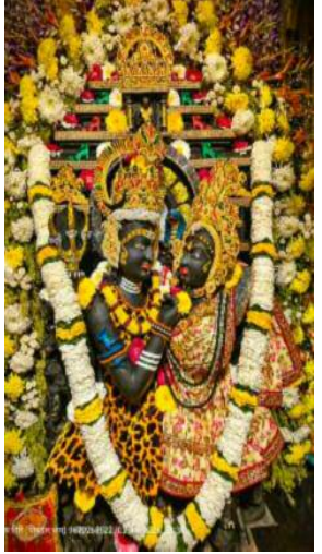
श्रद्धालुओं ने दर्शन किया। भोर से