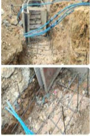
प्रदेश की जीरो टॉलेंस की नीति पर चलने वाली योगी सरकार में

उड़ाई जा रही है मानक के अनुसार डाला की काली मिट्टी प्रयोग में लाना है लेकिन विभाग द्वारा अहरोरा की सफेद मिट्टी प्रयोग में लाई जा रही है वहीं पक्के वर्ग के कार्य में कही भी भस्सी का प्रयोग नहीं करना है फिर भी धड़ल्ले से भासी प्रयोग हो रही है नाली के सीसी ढलाई में सरिया तीन सूत की प्रयोग में लाना है सरिया की जाली निर्माण में सात से आठ इंच पर गुच्छाई करनी है लेकिन विभाग द्वारा एक से दो फीट पर सरिया का प्रयोग किया जा रहा है जो मानक के विपरीत है नाली ढलाई हो रही अनियमितता से क्षेत्रवासियों में भारी नाराजगी है।