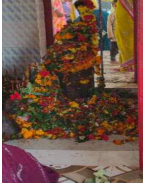
मंदिर, प्राचीन हनुमान मंदिर, शीतला