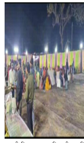
इसकी शिकायत अनुविभागीय अधि

शहनाई के गूंज की ताना बाना बीना जा रहा था। मामला उमरिया जिले के पाली बिकास खंड का है, जहाँ पर माध्यमिक विद्यालय बेली में परीक्षा के दौरान विद्यालय परिसर में शहनाई की गूंज सुनाई दे रही थी। अमूमन विद्यालय परिसरों में इस तरह के शादी समारोहों में एक लंबे समय से ही प्रशासन रोक लगा रखी है, फिर परीक्षा का दौर हो तो इस तरह के समारोह ही नहीं विद्यालय परिसर में कलेक्टर उमरिया ने जिले भर के परीक्षा में केन्द्रों में निशेषाधना लगा रखी है, लेकिन बेली विद्यालय में पदस्थ शिक्षा विभाग का जिम्मेदार अमला इन सब बातों की अनदेखी