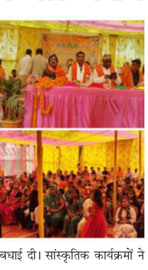
बधाई दी। सांस्कृतिक कार्यक्रमों ने

में उन्होंने समाज के संगठन और उत्थान पर जोर देते हुए कहा कि शिक्षा ही वह सशक्त माध्यम है, जिसके द्वारा न केवल समाज बल्कि राष्ट्र का भी समग्र विकास संभव है। उन्होंने युवाओं से शिक्षा के प्रति सजग रहने और समाज को आगे बढ़ाने का आह्वान किया। सभा को विभिन्न वक्ताओं ने क्रमवार संबोधित किया। विशिष्ट अतिथियों ने कानू समाज की एकजुटता की सराहना करते हुए सभी को होली की शुभकामनाएं दीं। समारोह के दौरान पारंपरिक अबीर-गुलाल के साथ लोगों ने एक-दूसरे को होली की