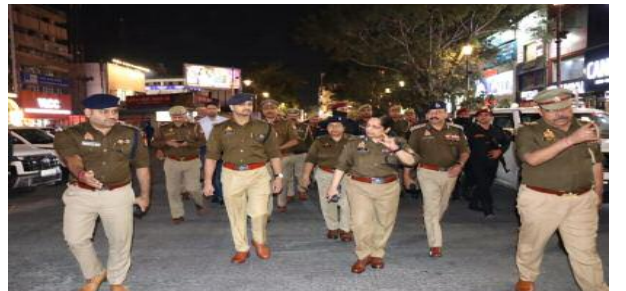
निर्देश दिए गए तथा संवेदनशील स्थानों पर विशेष सतर्कता बरतने के निर्देश जारी किए गए। पुलिस

नोएडा। होली के पावन पर्व एवं रमजान माह के दौरान कानून एवं सुरक्षा व्यवस्था को सुदृढ़ बनाए रखने के उद्देश्य से सीपी नोएडा द्वारा नोएडा जॉन के सेक्टर-18 मार्केट, भीड़-भाड़ वाले क्षेत्रों तथा मेट्रो स्टेशनों पर पुलिस अधिकारियों और पुलिस बल के साथ भ्रमण कर सुरक्षा व्यवस्थाओं का जायजा लिया गया। इस दौरान संबंधित अधिकारियों को आवश्यक दिशा-