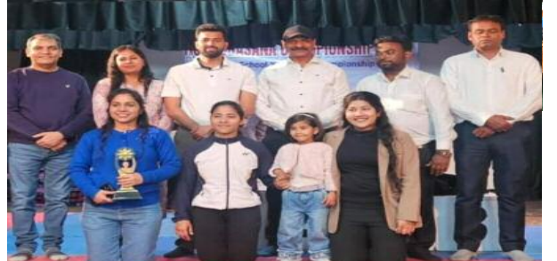
टीरस्टिक योगासन, टिव्स्टिंग योगासन लेग बैलेस, बैक बेंडिंग, फॉरवर्ड बेंडिंग

गाजियाबाद। 22 फरवरी 2026 को बाल भारतीय पब्लिक स्कूल ब्रिज विहार में डीवाईएसए गाजियाबाद द्वारा एनसीआर योगासन चैंपियनशिप 2026 का भव्य आयोजन किया गया। प्रतियोगिता में एनसीआर क्षेत्र के विभिन्न विद्यालयों के छात्रों ने उत्साहपूर्वक भाग लिया।