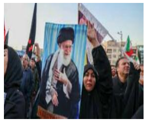
तैनाती और निगरानी पूरे जनपद में 5,000 से अधिक पुलिस बल तैनात किए गए हैं। संवेदनशील इलाकों में अतिरिक्त फोर्स तैनात किया गया और ड्रोन की मदद से शरारती तत्वों पर निगरानी

नोएडा। नोएडा पुलिस ने आयतुल्लाह हुसैनी खामेनेई की मौत और आगामी होली पर्व को देखते हुए पूरे जिले में सुरक्षा कड़ी कर दी है।