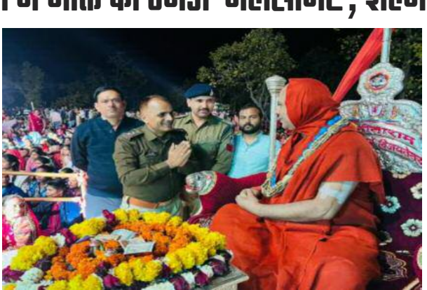
रामशिला की परिक्रमा से मनोकामना पूर्ण होने की मान्यता चरण तीर्थ पावनधाम क्षेत्र का एक अत्यंत श्रद्धेय धार्मिक स्थल है। यहां स्थित पवित्र रामशिला के संबंध में मान्यता है कि श्रद्धा और विश्वास के साथ इसकी परिक्रमा करने से मनवांछित फल की प्राप्ति होती है तथा जीवन में सुख-शांति एवं समृद्धि आती है। इसी आस्था के साथ दूर-दूर से श्रद्धालु यहां पहुंचकर भगवान श्रीराम के चरणों में अपनी भक्ति अर्पित करते हैं।