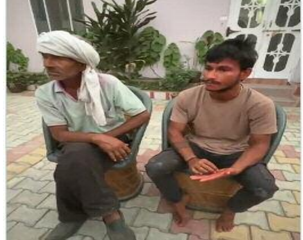
द्वारा पीड़ित परिवार का पूरा सहयोग किया जा रहा है। पुलिस ने बताया कि सोशल मीडिया पर इस प्रकार