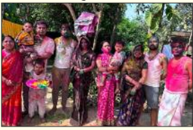
कोरोती गांव हर्ष उल्लास से होली मनाते ग्रामीण।