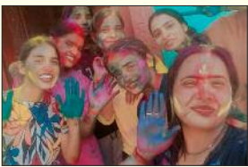
वाराणसी जिले के खरगपुर गांव होली खेलती युवतियां