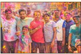
आर्दश गांव जयापुर में होली खेलते युवा।