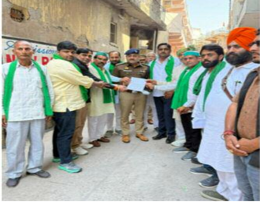
कर दिया गया, जिसका संगठन ने विरोध किया।

समाज जागरण ग्रेटर नोएडा। किसानों की समस्याओं को लेकर सक्रिय भारतीय किसान यूनियन (भानु) के पदाधिकारियों को पुलिस प्रशासन ने गुरुवार को नजरबंद कर दिया। संगठन के पदाधिकारी आज प्रदेश के मुख्यमंत्री योगी आदित्यनाथ को किसानों की समस्याओं से संबंधित जापन देने की तैयारी कर रहे थे। जानकारी के अनुसार मुख्यमंत्री का ग्रेटर नोएडा में एक निजी अस्पताल के लोकार्पण कार्यक्रम में आगमन प्रस्तावित था। इसकी सूचना मिलने पर भाकियू (भानु) ने किसानों की समस्याओं को लेकर मुख्यमंत्री को जापन सौंपने का निर्णय लिया था। जैसे ही इसकी जानकारी पुलिस प्रशासन को मिली, संगठन के कई पदाधिकारियों को नजरबंद