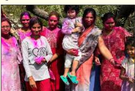
रंग में सराबोर दिखी ग्रामीण क्षेत्र बरेमा गांव की युवतियां।