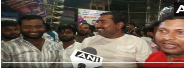
बाहर भी जश्न का माहौल रहा और प्रशंसकों ने टीम की जीत पर खुशी जताई। इस जीत को प्रतियोगिता में भारत के लिए बेहद महत्वपूर्ण माना जा रहा है।

समाज जागरण मोहाली (पंजाब)। आईसीसी पुरुष टी-20 विश्व कप के मुकाबले में भारतीय क्रिकेट टीम ने इंग्लैंड क्रिकेट टीम को 7 रन से हराकर शानदार जीत दर्ज की। पंजाब के मोहाली में खेले गए इस रोमांचक मुकाबले के बाद क्रिकेट प्रेमियों में जबरदस्त उत्साह देखा गया। मैच के बाद एक प्रशंसक ने कहा कि आज होली की खुशियां देगुनी हो गई हैं। उन्होंने कहा कि भारत की इस जीत के बाद मैदान के