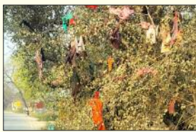
वाराणसी में होली के बाद कपड़ा फाड़ होली खेली जाती जिसमें लोगों का कपड़ा फाड़ कर फेंका जाता है। चोखंडी में कपड़ा फाड़ होली के बाद पेड़ पर टंगे फटे कपड़े।