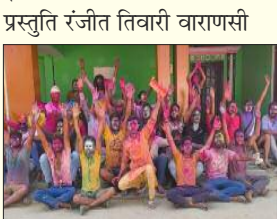
सेवापुरी विकास खंड के बेरमा गांव होली खेलते युवक।

रंगों का पर्व होली बनारसियों ने बड़े धूम धाम से मनाया, कहीं डोल नगाड़े तो कहीं डीजे पर झूमते दिखे युवा झुंझुंकार के सुबह से शाम तक काशी के युवक, युवतियां होली में सराबोर दिखे, जिसकी कुछ झलकियां। प्रस्तुति रंजीत तिवारी वाराणसी