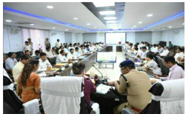
जानकारी रखने तथा फील्ड में जाकर निरीक्षण करने के निर्देश दिए। समीक्षा बैठक में जिला उद्योग केन्द्र के कार्यों पर असंतोष जताते हुए प्रमुख सचिव