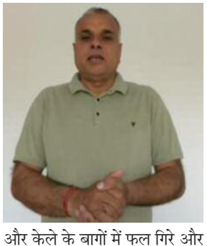
और केले के बागों में फल गिरे और

छिटपुट ओलावृष्टि हुई। इस प्राकृतिक आपदा से न सिर्फ पकी हुई गेहूं और सरसों की फसलें, बल्कि सब्जी और बागवानी भी बुरी तरह प्रभावित हुई हैं। गेहूं की बालियां बिछ गईं, दाने पतले हो गए और ओलों से पत्तियां फट गईं। सरसों में फूल-दाने झड़ गए। साथ ही टमाटर, बैंगन, मिर्च, आलू जैसी सब्जियों में फल फटने और पौधे गिरने की शिकायतें आई हैं। बागवानी में आम, अमरूद, नींबू