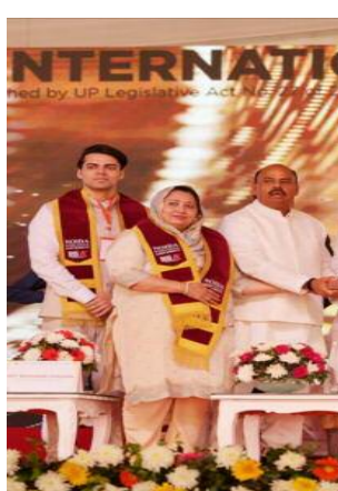
किया और विद्यार्थियों के उज्वल भविष्य की कामना की।

कई गणमान्य रहे मौजूद इस अवसर पर कई विशिष्ट अतिथि