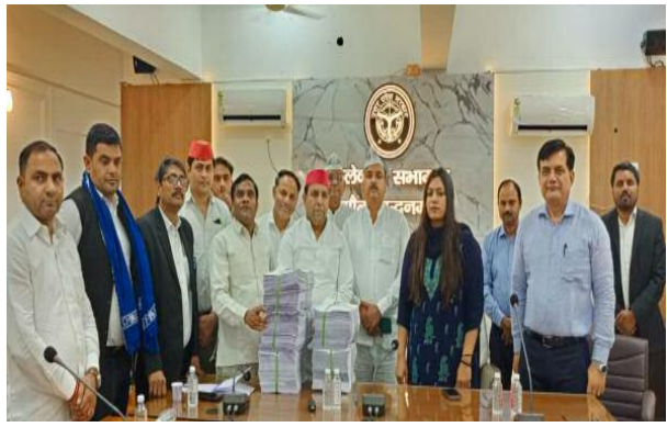
अधिकारी द्वारा भारत निर्वाचन आयोग के दिशा-निर्देशों एवं निर्वाचन रजिस्ट्रीकरण नियम,

गौतमबुद्धनगर, 10 अप्रैल 2026। भारत निर्वाचन आयोग के निर्देशों के क्रम में चल रहे विशेष प्रगाढ़ पुनरीक्षण कार्यक्रम 2026 के अंतर्गत जनपद की विधानसभा निर्वाचन क्षेत्रों की अंतिम निर्वाचक नामावलिओं (मतदाता सूची) का प्रकाशन कर दिया गया है। इसी क्रम में आज प्रातः 11 बजे कलेक्ट्रेट सभागार में जिला निर्वाचन अधिकारी की अध्यक्षता में सभी मान्यता प्राप्त राजनीतिक दलों के प्रतिनिधियों के साथ एक महत्वपूर्ण बैठक आयोजित की गई। बैठक के दौरान जिला निर्वाचन