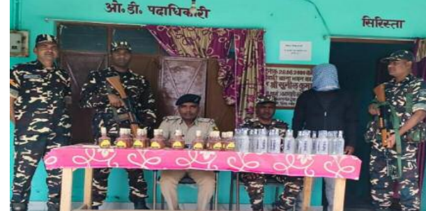
कार्रवाई नियमित गश्ती के दौरान की गई। इस संबंध में टेढ़ागछ थाना में मामला दर्ज कर आगे की विधिसम्मत कार्रवाई की जा रही है। किशनगंज पुलिस ने बताया कि