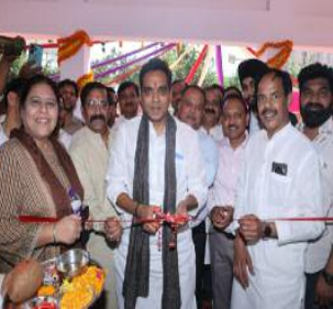
उपस्थित रहे। यह सम्पवैल ग्राम सदरपुर और सेक्टर-45 से निकलने वाले सीवेज के निस्तारण के लिए तैयार किया गया है, जिसे सेक्टर-168 स्थित सीवेज ट्रीटमेंट प्लांट में

समाज जागरण/संदीप गर्ग नोएडा, संवाददाता। नोएडा क्षेत्र में बढ़ते जनसंख्या घनत्व को देखते हुए ग्राम सदरपुर एवं सेक्टर-45 की सीवेज समस्या के निस्तारण के लिए नवनिर्मित सम्पवैल का उद्घाटन किया गया। इस सम्पवैल का उद्घाटन माननीय विधायक कंकज सिंह द्वारा किया गया। इस अवसर पर माननीय स-ंसद, गौतमबुद्धनगर के प्रतिनिधि, नोएडा प्राधिकरण के अपर मुख्य कार्यपालक अधिकारी (एसपी) तथा महाप्रबंधक (जल) भी