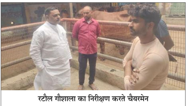
स्टौल गौशाला का निरीक्षण करते चैयरमैन