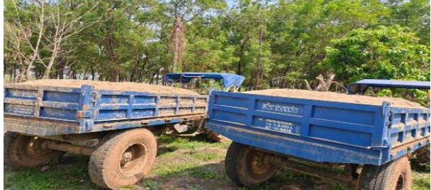
पुलिस ने जब्त कर थाना परिसर में सुरक्षित रखा है। इस मामले में संबंधित व्यक्तियों के विरुद्ध विधि सम्मत कार्रवाई की जा रही है। पुलिस ने स्पष्ट किया है कि अवैध खनन एवं परिवहन के खिलाफ अभियान आगे भी जारी रहेगा।