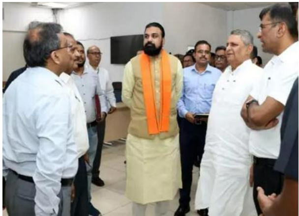
उपलब्ध कराना सरकार की सर्वोच्च प्राथमिकता है। उन्होंने कहा की भ्रष्टाचार के खिलाफ जियो रॉलरेंस की नीति अपनाई जाएगी और विभागों में पूर्ण पारदर्शिता सुनिश्चित करनी होगी। उन्होंने विशेष रूप से

पटना/ बिहार के नवनियुक्त मुख्यमंत्री सम्राट चौधरी ने पदभार ग्रहण करते ही शासन व्यवस्था को पटरी पर लाने के लिए प्रशासनिक सक्रियता बढ़ा दी है। मुख्यमंत्री बनने के दूसरे ही दिन उन्होंने वरिष्ठ अधिकारियों के साथ उच्चस्तरीय बैठक की और स्पष्ट लहजे में कहा कि अब केवल योजनाएं बनाना काफी नहीं है, बल्कि जमीन पर उनके ठोस परिणाम दिखने चाहिए। मुख्यमंत्री सचिवालय में आयोजित बैठक में सीएम ने मुख्य सचिव प्रत्यय अमृत सहित तमाम आला अधिकारियों को निर्देशित किया कि जनता को त्वरित सेवाएं