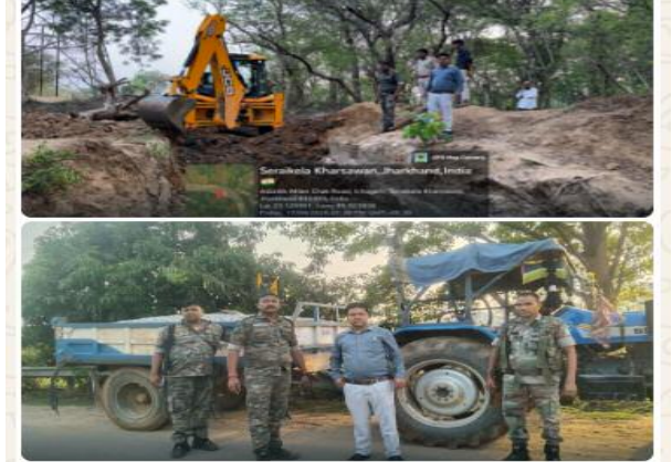
किए गए बालू के डंप पर भी छापेमारी की गई। कार्रवाई के क्रम में एक अवैध गिट्टी लदा ट्रैक्टर को जब्त कर ईचागढ़ थाना में सुरक्षित रखा गया है। प्रशासन ने स्पष्ट किया है कि अवैध खनन और परिवहन के खिलाफ आगे भी लगातार अभियान जारी रहेगा तथा दोषियों के विरुद्ध कड़ी कार्रवाई की जाएगी।