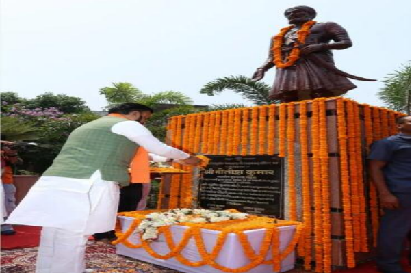
विभिन्न सामाजिक संगठनों और स्थानीय नागरिकों ने बड़ी संख्या में भाग लिया।

विभिन्न सामाजिक संगठनों और स्थानीय नागरिकों ने बड़ी संख्या में भाग लिया। इस दौरान भामाशाह के जीवन पर आधारित सांस्कृतिक प्रस्तुतियाँ भी दी गईं, जिनका उद्देश्य युवा पीढ़ी को उनके गौरवशाली इतिहास से परिचित कराना था। विशेषज्ञों और उपस्थित जनसमूह ने सरकार की इस पहल को सराहते हुए कहा कि ऐसे आयोजनों से समाज में सकारात्मक ऊर्जा और देशभक्ति का संचार होता है। मुख्यमंत्री ने अंत में सभी से भामाशाह के पदचिह्नों पर चलने और व्यक्तिगत स्वार्थ से ऊपर उठकर राष्ट्रहित में कार्य करने का आह्वान किया।