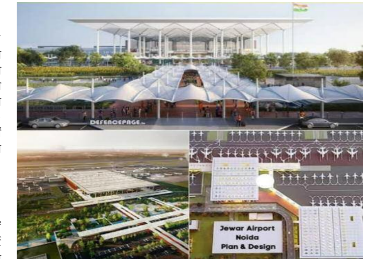
को सहज, तेज और सुविधाजनक यात्रा अनुभव प्रदान करने के साथ-साथ एयरलाइंस को लागत-कुशल संचालन सुविधा भी उपलब्ध कराई जाएगी।

के अनुरूप हैं। इंडिगो संचालित करेगी पहली उड़ान एयरपोर्ट प्रबंधन के अनुसार पहली निर्धारित यात्री उड़ान इंडिगो द्वारा संचालित की जाएगी। इसके बाद शीघ्र ही अकासा, एयर और एयर इंडिया एक्सप्रेस भी अपनी सेवाएं शुरू करेंगी। उड़ानों की समय-सारणी, गंतव्यों और अन्य यात्री सुविधाओं की विस्तृत जानकारी जल्द साझा की जाएगी। आधुनिक सुविधाओं से लैस होगा एयरपोर्ट बढ़ती हवाई यात्रा की मांग को ध्यान में रखते हुए विकसित किया गया यह एयरपोर्ट आधुनिक टर्मिनल अवसंरचना, कुशल संचालन प्रणाली और मजबूत मल्टीमॉडल कनेक्टिविटी से सुसज्जित होगा। यात्रियों