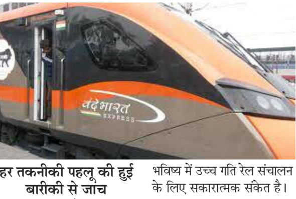
हर तकनीकी पहलू की हुई बारीकी से जांच

समाज जागरण कोटा। भारतीय रेलवे के लिए एक महत्वपूर्ण उपलब्धि सामने आई है। कोटा रेल मंडल में वंदे भारत ट्रेनसेट ने स्पीड ट्रायल के दौरान 180 किलोमीटर प्रति घंटे की रफ्तार हासिल कर ली। यह ट्रायल पूरी तरह सफल रहा, जिससे रेलवे की आधुनिक तकनीकी क्षमता का एक और उदाहरण सामने आया है।