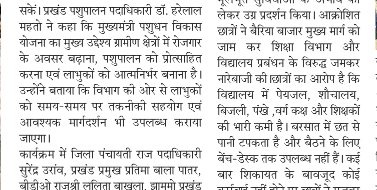
अधिकारियों ने बतखों की देखभाल, संतुलित पोषण, रोगों से बचाव एवं वैज्ञानिक तरीके से पालन करने की विस्तृत जानकारी साझा की, ताकि लामुक योजना का समुचित लाभ उठा

समाज जागरण, संवाददाता इंचागढ़/कुकरडू : कुकरडू प्रखंड कार्यालय परिसर में शनिवार को कृषि, पशुपालन एवं सहकारिता विभाग की ओर से मुख्यमंत्री पशुधन विकास योजना के तहत बतख चूजा वितरण शिविर का आयोजन किया गया। शिविर में चयनित 24 लामुकों के बीच बतख चूजा का वितरण किया गया। प्रत्येक युक्ति में 30-30 बतख चूजा प्रदान किए गए, जिससे ग्रामीणों को स्वरोजगार से जोड़ने की पहल की गई। कार्यक्रम प्रखंड प्रशासन की देखरेख में संपन्न हुआ। इस अवसर पर लामुकों को बतख पालन से संबंधित आवश्यक जानकारी भी दी गई।