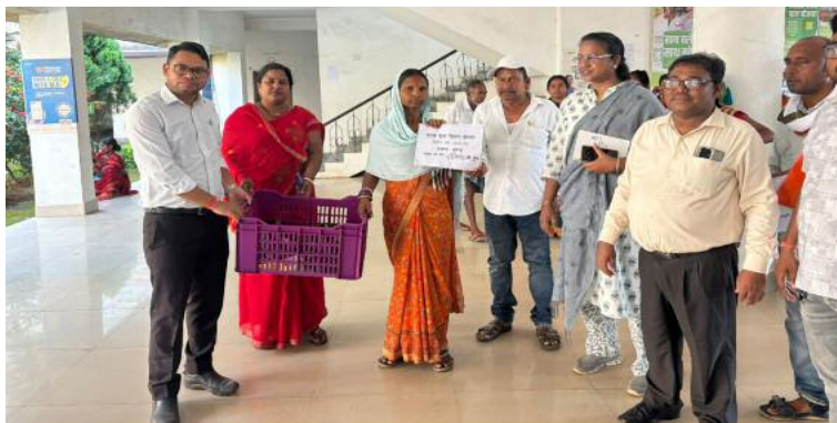
अधिकारियों ने बतखों की देखभाल, संतुलित पोषण, रोगों से बचाव एवं वैज्ञानिक तरीके से पालन करने की विस्तृत जानकारी साझा की, ताकि लामुक योजना का समुचित लाभ उठा

समाज जागरण, संवाददाता इंचागढ़/कुकरडू : कुकरडू प्रखंड कार्यालय परिसर में शनिवार को कृषि, पशुपालन एवं सहकारिता विभाग की ओर से मुख्यमंत्री पशुधन विकास योजना के तहत बतख चूजा वितरण शिविर का आयोजन किया गया। शिविर में चयनित 24 लामुकों के बीच बतख चूजा का वितरण किया गया। प्रत्येक युक्ति में 30-30 बतख चूजा प्रदान किए गए, जिससे ग्रामीणों को स्वरोजगार से जोड़ने की पहल की गई। कार्यक्रम प्रखंड प्रशासन की देखरेख में संपन्न हुआ। इस अवसर पर लामुकों को बतख पालन से संबंधित आवश्यक जानकारी भी दी गई।