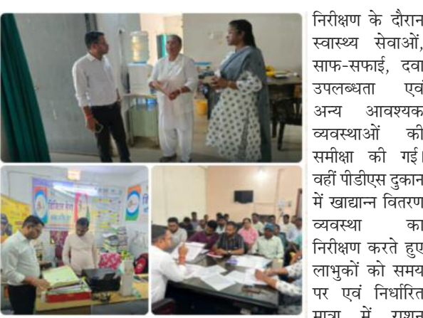
निरीक्षण के दौरान स्वास्थ्य सेवाओं, साफ-सफाई, दवा उपलब्धता एवं अन्य आवश्यक व्यवस्थाओं की समीक्षा की गई। वहीं पीडीएस दुकान में खाद्यान्न वितरण व्यवस्था का निरीक्षण करते हुए लामुकों को समय पर एवं निश्चित मात्रा में राशन उपलब्ध कराने का निर्देश दिया गया। इसके अलावा पंचायत भवन में संचालित योजनाओं और अभिलेखों की भी जांच की गई। निरीक्षण के दौरान विभिन्न विभागों के संबंधित पदाधिकारी एवं कर्मचारी मौजूद रहे।

समाज जागरण, संवाददाता इंचागढ़/कुकरडू: सरायकेला-खरसावां जिला पंचायती राज पदाधिकारी सह कुकरडू प्रखंड के वरीय पदाधिकारी श्री सुरेंद्र उरांव ने कुकरडू प्रखंड क्षेत्र में संचालित विभिन्न जनकल्याणकारी योजनाओं एवं संस्थानों का औचक निरीक्षण किया। इस दौरान उन्होंने प्रधानमंत्री आवास योजना, अनुभू आवास योजना, पीडीएस दुकान, तिरुलडीह उप स्वास्थ्य केंद्र तथा पंचायत भवन पहुंचकर व्यवस्थाओं और योजनाओं के क्रियान्वयन की स्थिति का जायजा लिया। निरीक्षण के क्रम में डीपीआरओ ने संबंधित अधिकारियों एवं कर्मचारियों को योजनाओं का गुणवत्तापूर्ण और समयबद्ध तरीके से संचालन सुनिश्चित करने का निर्देश दिया। उन्होंने कहा कि सरकार की योजनाओं का लाभ आम लोगों तक पारदर्शी और सरल तरीके से पहुंचाना चाहिए, इसमें किसी प्रकार की लापरवाही बर्दाश्त नहीं की जाएगी। तिरुलडीह उप स्वास्थ्य केंद्र के उपलब्ध कराने का निर्देश दिया गया। इसके अलावा पंचायत भवन में संचालित योजनाओं और अभिलेखों की भी जांच की गई। निरीक्षण के दौरान विभिन्न विभागों के संबंधित पदाधिकारी एवं कर्मचारी मौजूद रहे।