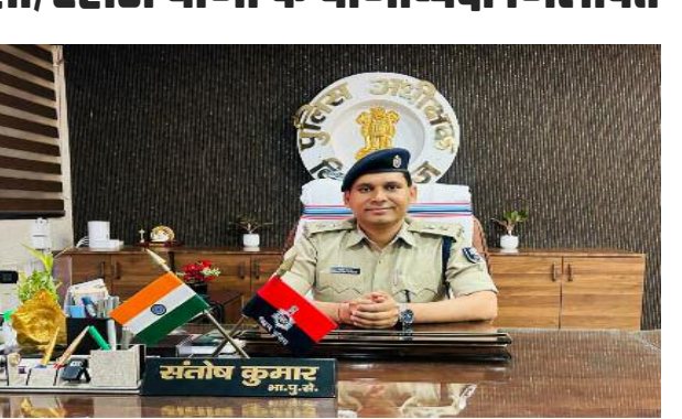
बाद ही मामला दर्ज किया गया। जांच के दौरान यह भी सामने आया कि कई गंभीर मामलों में अभियुक्तों की गिरफ्तारी एवं कांड के निष्पादन की दिशा में अपेक्षित कार्रवाई नहीं की गई तथा केवल औपचारिकता निभाई गई। इसके अलावा कई आवेदनों में समझौता दशायों गया, जो संतोषजनक नहीं पाया गया। कई मामलों में आवेदन प्राप्ति की तिथि और प्राथमिकी दर्ज होने की तिथि में भी अंतर पाया गया, जिसे विभागीय नियमों के विरुद्ध माना गया। इन आरोपों को कर्तव्य के प्रति घोर