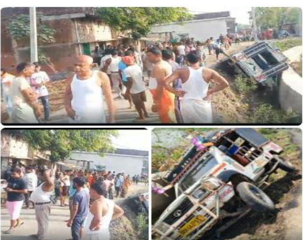
लापरवाही के बाद शिवम पब्लिक स्कूल प्रबंधन पर सवालिया निशान लग रहे हैं। अधिकांश बच्चों में आक्रोश है कि बच्चों की सुरक्षा के साथ इतना बड़ा खिलवाड़ कैसे हुआ। स्कूल वाहन की फिटनेस और चालक की उम्र की जांच किए बिना बच्चों को कैसे भेजा जा रहा था। हादसा के संबंध में विद्यालय के प्राचार्य से संपर्क करने का प्रयास किया गया, परंतु प्राचार्य द्वारा फोन रिसीव नहीं किया गया। स्थानीय लोगों ने प्रशासन से मांग की है कि मामले की जांच कर दोषी स्कूल प्रबंधन और वाहन मालिक पर कड़ी कार्रवाई की जाए। पुलिस हादसे की जांच में जुट गई है। गौरतलब है कि नबीनगर में कई निजी विद्यालय बिना सरकारी निबंधन और गाइडलाइन के कुकुरमुते की तरह संचालित हैं।

समाज जागरण अनिल कुमार संवाददाता नबीनगर (औरंगाबाद) नबीनगर (बिहार)नगर पंचायत नबीनगर के बाहर 5 स्थित रामनगर गांव के समीप शुक्रवार को सुबह बड़ा हादसा हो गया। नबीनगर के निजी विद्यालय शिवम पब्लिक स्कूल की एक वाहन चरकका वाहन अनियंत्रित होकर पलट गई। वाहन में सवार लगभग 20 बच्चे घायल हो गए। हादसे के बाद सभी घायल बच्चों को आनन-फानन में विभिन्न निजी क्लिनिक में भर्ती कराया गया। कई बच्चों को गंभीर चोटें आई हैं जिनका एक्स-रे कराकर इलाज किया जा रहा है। गमोमत रही कि कोई बड़ा हादसा नहीं हुआ। ग्रामीणों के अनुसार दुर्घटनाग्रस्त वाहन काफी पुराने मॉडल की थी। सबसे बड़ी लापरवाही यह सामने आई कि वाहन को एक नाबालिग चालक चला रहा था। ग्रामीणों ने बताया कि वाहन में करीब 20 से 25 बच्चे सवार थे जिनमें अधिकांश को मामूली से लेकर गंभीर चोटें आई हैं। इस