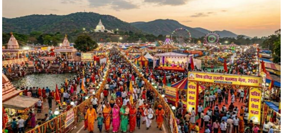
कार्यक्रम के दौरान सुबह 6:30 से 9 बजे तक तीर्थ पूजन और आरती का आयोजन किया जाएगा। इसके बाद 9 बजे ध्वजारोहण कार्यक्रम संपन्न होगा। मुख्यमंत्री द्वारा ब्रह्मकुंड परिसर स्थित लक्ष्मीनारायण

राजगीर (बिहार)। ऐतिहासिक और धार्मिक नगरी राजगीर में आयोजित होने वाले मलमास मेला 2026 की तैयारियां अंतिम चरण में पहुंच गई हैं। 17 मई से शुरू होकर 15 जून तक चलने वाले इस भव्य मेले को लेकर पूरे ब्रह्मकुंड क्षेत्र में सजावट और व्यवस्थाओं को अंतिम रूप दिया जा रहा है। मेले के शुभारंभ अवसर पर रविवार को ब्रह्मकुंड परिसर स्थित यज्ञशाला में धार्मिक अनुष्ठानों के साथ कार्यक्रम का आगाज होगा। उद्घाटन समारोह में बिहार सरकार के मुख्यमंत्री सम्राट चौधरी मुख्य अतिथि के रूप में शामिल होंगे। उनके मुख्यमंत्री बनने के बाद यह उनका राजगीर का पहला दौरा होगा।