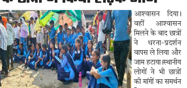
आश्वासन दिया। वहीं आश्वासन मिलने के बाद छात्रों ने धरना-प्रदर्शन वापस ले लिया और जाम हटाया। स्थानीय लोगों ने भी छात्रों की मांगों का समर्थन किया। उनका कहना है कि शिक्षा के अधिकार के तहत हर स्कूल में बुनियादी सुविधाएं देना सरकार की जिम्मेदारी है। लगातार अनदेखी के कारण छात्रों का गुस्सा फूटा है। शिक्षा विभाग की लापरवाही पर अब सवाल खड़े हो रहे हैं। प्रभारी बीईओ ने कहा कि विद्यालय का निरीक्षण कर जल्द रिपोर्ट तैयार की जाएगी और प्राथमिकता के आधार पर समस्याओं का समाधान किया जाएगा।

समाज जागरण अनिल कुमार संवाददाता नबीनगर (औरंगाबाद) नबीनगर (बिहार)नबीनगर प्रखंड के बैरिया उच्च विद्यालय के छात्र-छात्राओं ने शनिवार को विद्यालय में मूलभूत सुविधाओं के अभाव को लेकर उग्र प्रदर्शन किया। आक्रोशित छात्रों ने बैरिया बाजार मुख्य मार्ग को जाम कर शिक्षा विभाग और विद्यालय प्रबंधन के विरुद्ध जमकर नारेबाजी की। छात्रों का आरोप है कि विद्यालय में पेयजल, शौचालय, बिजली, पंखे, वगैरह और शिक्षकों की भारी कमी है। बरसात में छत से पानी टपकता है और बैठने के लिए बेंच-डेस्क तक उपलब्ध नहीं हैं। कई वार शिकायतों के बावजूद भी कोई कार्रवाई नहीं होने पर छात्रों ने मजबूर होकर सड़क जाम किया। छात्रों ने बताया कि बिहार बोर्ड की 2026