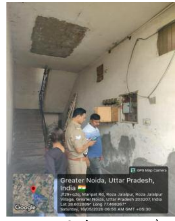
तथा राजस्व हानि को न्यूनतम करना है। साथ ही विभाग ने सभी उपभोक्ताओं से अपील की है कि वे केवल वैध कनेक्शन के माध्यम से ही विद्युत का उपयोग करें। विद्युत चोरी एक गंभीर एवं दंडनीय अपराध है, जिसके लिए कठोर कानूनी कार्रवाई की जाएगी। अधिशासी अभियंता, नगरीय विद्युत वितरण खंड-रेड, नोएडा ने कहा कि हर्राष्ट्रहित में बिजली बचाना और ईमानदारी से उपयोग करना सभी नागरिकों का दायित्व है।