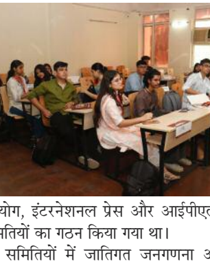
आयोग, इंटरनेशनल प्रेस और आईपीएल जैसी सात समितियों का गठन किया गया था। इन समितियों में जातिगत जनगणना और आरक्षण