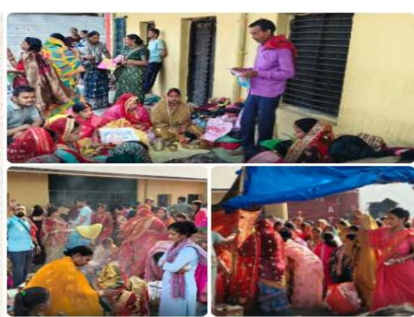
सावित्री व्रत करने से महिलाओं को अखंड सौभाग्य का वरदान मिलता है। सावित्री ने इसी दिन यमराज से अपने पति सत्यवान के प्राण वापस लिए थे। इसी कारण सुहागिनें पति की दीर्घायु के लिए यह व्रत रखती हैं। सुबह से ही वट वृक्षों के नीचे महिलाओं की भीड़ जुटी रही। बाजारों में भी पूजा सामग्री, फल और सुहागिण के सामान की खूब बिक्री हुई। पूरे नबीनगर में धार्मिक माहौल बना रहा।

समाज जागरण अनिल कुमार संवाददाता नबीनगर (औरंगाबाद) नबीनगर (बिहार) नबीनगर में शुक्रवार को वट सावित्री व्रत पारंपरिक श्रद्धा और उल्लास के साथ मनाया गया। पुरानी पीढ़ियों के समीप स्थित वट वृक्ष के नीचे सुहागिन महिलाओं ने एकत्रित होकर वट सावित्री की पूजा-अर्चना की। सुहागिण के प्रतीक वट सावित्री व्रत के मौके पर महिलाओं ने वट वृक्ष की परिक्रमा कर रक्षा सूत्र बांधा। पंडितों द्वारा विधि-विधान से पूजा कराई गई। महिलाओं ने सामूहिक रूप से सावित्री-सत्यवान की व्रत कथा सुनी और अपने पति की लंबी उम्र व अखंड सौभाग्य की कामना की। पूजा के बाद सुहागिनों ने ब्राह्मणों को फल, वस्त्र और दक्षिणा दान कर आशीर्वाद लिया। मान्यता है कि वट