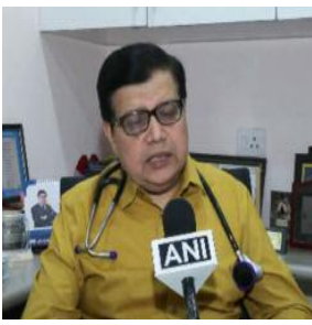
हीट रैश से लेकर हीट स्ट्रोक तक कई स्तर

नई दिल्ली। राजधानी दिल्ली में तापमान में लगातार बढ़ोतरी के बीच अस्पतालों में हीट-रिलेटेड बीमारियों के मामले बढ़ने लगे हैं। विशेषज्ञों का कहना है कि गर्मी से जुड़ी बीमारियां अब आम होती जा रही हैं और समय पर पहचान व इलाज न होने पर यह जानलेवा भी साबित हो सकती हैं।