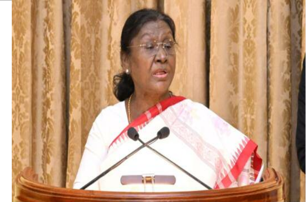
राष्ट्रपति का यह संदेश देश में सामाजिक समरसता, करुणा और एकता को बढ़ावा देने की भावना को और मजबूत करता है।

नई दिल्ली। राष्ट्रपति द्रौपदी मुर्मू ने ईद-उल-अजहा की पूर्व संध्या पर देशवासियों को हार्दिक शुभकामनाएं दी हैं। उन्होंने देश और विदेश में रहने वाले सभी भारतीयों, विशेषकर मुस्लिम समुदाय के लोगों को इस पावन अवसर पर बधाई और मंगलकामनाएं प्रेषित कीं। त्याग और समर्पण का पर्व अपने संदेश में राष्ट्रपति ने कहा कि ईद-उल-अजहा त्याग, समर्पण और बलिदान का प्रतीक