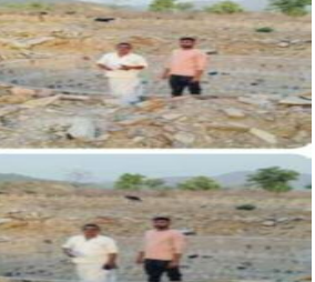
हो गया। जिसको लेकर जे०ई० के साथ-साथ विभागीय अधिशासी अभियंता को भी उक्त कूप को लेकर लिखित एवं मौखिक समेत दूरभाष से भी अवगत कराया गया किन्तु आज तक केवल झूठा आश्वासन ही दिया जा रहा है जिसको लेकर मानसिक रूप से बहुत ही परेशान है। इससे ठेकेदार द्वारा धमकियां दी जा रही है कि जाओं जहां शिकायत करनी हो, कर लो कुछ भी नहीं उखाड़ सकते। तबतमान में बरसात का मौसम भी आने वाला है। यदि बरसात से पहले कुएं का निर्माण आदि कार्य पूर्ण नहीं किया गया तो

फिर संभव नहीं है। विश्वस्त सूत्रों से यह पता चला है कि उक्त कूप निर्माण का संपूर्ण भुगतान भी कर लिया जा चुका है बावजूद इसके कार्य आज भी आधा अधूरा अर्ध निर्मित है और मानक के विपरीत कार्य किया गया है। इलाके के तमाम किसान बंधुओं ने उक्त अर्द्धनिर्मित कुएं निर्माण का उच्च स्तरीय जांच कराकर कूप के कार्य को पूर्ण करवाते हुए दोषियों के विरुद्ध उचित कानूनी कार्रवाई करवाये जाने की मांग की है ताकि कूप निर्माण कार्य में हुए सरकारी धन की लूट-खसोट का पदाफांश तथा संबंधितों के खिलाफ भ्रष्टाचार निवारण समेत अन्य धाराओं में कानूनी कार्रवाई सुनिश्चित हो सके। देखाअब यह है कि इस संबंध में अर्ध निर्मित कूप का निर्माण पूर्ण हो पाता है अथवा नहीं तथा कहाँ तक संबंधितों के खिलाफ उच्च स्तरीय जांचकर कार्रवाई सुनिश्चित हो पाती है? लोगों की निगाहें अब विभागीय कार्रवाई पर टिकी हुई है।