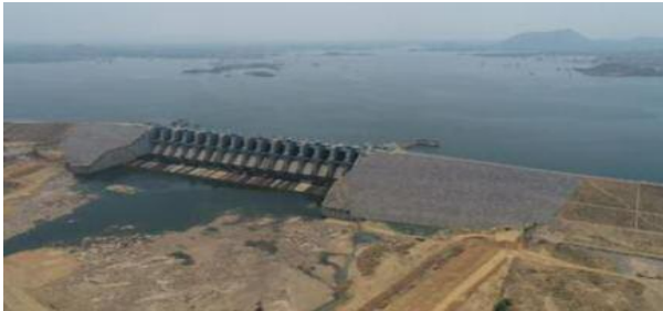
गई इस परियोजना को गति उत्तर प्रदेश की योगी सरकार के कार्यकाल में मिली। जिला प्रशासन ने भूमि अधिग्रहण से जुड़ी आपत्तियों का त्वरित निस्तारण कर बांध और नहर निर्माण कार्य को आगे बढ़ाया। वर्तमान में 3.24 किलोमीटर लंबे एवं 39.9 मीटर ऊंचे बांध का निर्माण कार्य पूर्ण हो चुका है, जबकि

समाज जागरण/ विजय कुमार अग्रहरी सोनभद्र। जिले की बहुप्रतीक्षित कनहर सिंचाई परियोजना अब अपने अंतिम चरण में पहुंच चुकी है। दुइडी तहसील क्षेत्र में निर्माणाधीन इस महत्वाकांक्षी परियोजना के पूरा होने के बाद दुइडी और ओबरा क्षेत्र के 108 गांवों के हजारों किसानों को सिंचाई के लिए पर्याप्त पानी उपलब्ध होगा। साथ ही करीब दो लाख लोगों की पेयजल समस्या का भी स्थायी समाधान हो सकेगा। प्रशासन का दावा है कि जनवरी 2027 से किसानों को परियोजना का प्रत्यक्ष लाभ मिलने लगेगा। किसानों की सिंचाई और पेयजल आवश्यकताओं को पूरा करने के उद्देश्य से शुरू की