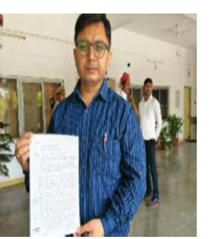
परेशानी मरीजों, बुजुर्गों, महिलाओं और स्कूल जाने वाले बच्चों को उठानी पड़ती है। कई बार ऐसी स्थिति उत्पन्न हो जाती है कि दोपहिया वाहन तक सड़क पर नहीं चल पाते। ग्रामीणों का कहना है कि इस संबंध में कई बार संबंधित अधिकारियों को अवगत कराया गया, लेकिन अब तक कोई ठोस कदम नहीं उठाया गया। इस मामले में ग्रामीण अभिभंग