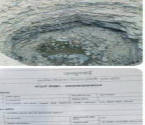
से पथर को आधा अधूरा करीब 17-18 फीट खोदवाकर कूप के पथर के उपर बोल्टर से दिवाल बनाया जाने लगा। इस प्रकार विरोध किया गया और कहा गया कि कम से कम कूप मानक के अनुरूप खुदाई तो कराकर दीवाल निर्माण कराया जाय, लेकिन मसामानी पूर्ण उपेक्षात्मक रवैया अपनाते हुए संबंधित ठेकेदार व जे०ई० द्वारा कहा गया कि दीवाल बन जाने के पश्चात मशीन से कुएं को वृहद रूप बना दिया जायेगा, गहराई से लेकर चौड़ाई आदि सब फिट हो जायेगा। करीब तीन माह से ही निर्माण कार्य बन्द हुए