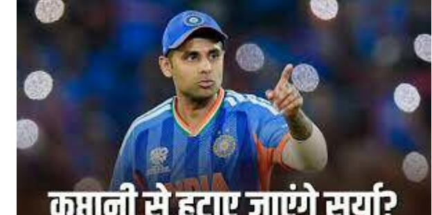
कप्तानी से हटाए जाएंगे सूर्या? बताया जा रहा है कि लगातार खराब प्रदर्शन को ही कप्तानी में बदलाव का प्रमुख कारण माना गया है। हालांकि, इस संबंध में भारतीय क्रिकेट बोर्ड की ओर से आधिकारिक घोषणा का इंतजार है।

नई दिल्ली। भारतीय टी20 टीम की कप्तानी अब सूर्यकुमार यादव से वापस ले ली गई है। उनके नेतृत्व में भारत ने टी20 वर्ल्ड कप 2026 का खिताब जरूर जीता, लेकिन पूरे टूर्नामेंट के दौरान उनका व्यक्तिगत प्रदर्शन बेहद निराशाजनक रहा।