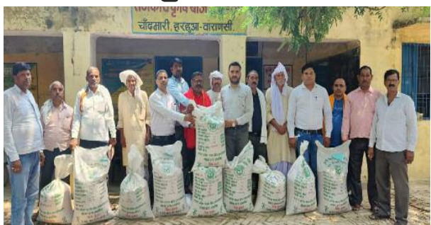
उपलब्ध कराई जाएगी।

हरहुआ, वाराणसी कृषि विभाग द्वारा पर्यावरण अनुकूल खेती को बढ़ावा देने के उद्देश्य से धान एकीकृत फसल विकास कार्यक्रम के अंतर्गत सीधी बुआई (डीएसआर) पद्धति प्रदर्शन हेतु हरहुआ विकासखंड के पुआरी-खुर्द गांव का चयन किया गया है। इस योजना के तहत चयनित किसानों को धान की सीधी बुआई के लिए आवश्यक कृषि निवेश शत-प्रतिशत अनुदान पर उपलब्ध कराए जा रहे हैं।