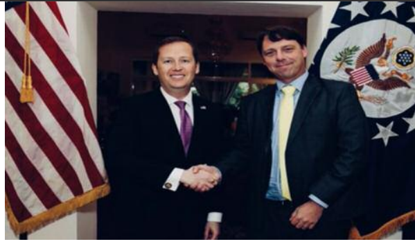
उद्देश्य से बातचीत सकारात्मक दिशा में आगे बढ़ रही है। राजदूत गोर ने कहा कि यह वार्ता प्रधानमंत्री नरेंद्र मोदी और अमेरिका के पूर्व राष्ट्रपति डोनाल्ड ट्रंप की उस सोच के अनुरूप है, जिसमें दोनों देशों के आर्थिक संबंधों को नई ऊंचाइयों