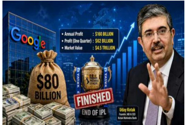
है कि वैश्विक स्तर पर बड़ी कंपनियों भविष्य की तकनीक, डेटा इंफ्रास्ट्रक्चर और आर्टिफिशियल इंटेलिजेंस जैसे क्षेत्रों में अत्यधिक पूंजी निवेश की तैयारी

नई दिल्ली। वैश्विक प्रौद्योगिकी क्षेत्र की दिग्गज कंपनी गूगल द्वारा भविष्य की रणनीतिक आवश्यकताओं के लिए लगभग 80 अरब डॉलर जुटाने की योजना को लेकर चर्चा तेज हो गई है। कंपनी के पास पहले से ही भारी नकदी भंडार और मजबूत वार्षिक लाभ होने के बावजूद यह कदम भविष्य की तकनीकी प्रतिस्पर्धा और निवेश आवश्यकताओं को देखते हुए उठाया जा रहा है।