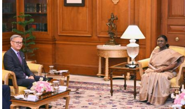
जो बौद्ध धर्म और रामायण की साझा सांस्कृतिक विरासत में स्पष्ट रूप से दिखाई देते हैं। उन्होंने उल्लेख किया कि दोनों देश इस वर्ष अपने राजनयिक संबंधों की 70वीं वर्षगांठ मना रहे हैं, जो

नई दिल्ली। राष्ट्रपति द्रौपदी मुर्मू से बुधवार को लाओ जनवादी लोकतांत्रिक गणराज्य के उप प्रधानमंत्री एवं विदेश मंत्री थोंगसावन फोमविहाने ने राष्ट्रपति भवन में शिष्टाचार भेंट की। यह उनकी भारत की पहली आधिकारिक यात्रा है। राष्ट्रपति ने उनकी गर्मजोशी से स्वागत किया।