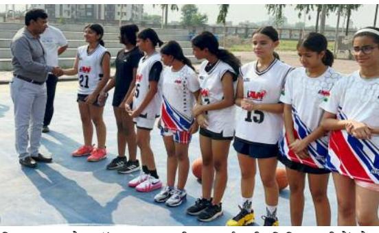
ड्विल्स बास्केटबॉल अकादमी, जीसस एंड मेरी कॉन्वेंट स्कूल, मलकपुर स्पोर्ट्स स्टेडियम, नोएडा बास्केटबॉल क्लब, बास्केटबॉल हीरोज, चैंप अकादमी और दादरी बास्केटबॉल क्लब की बालक एवं बालिका टीमों ने उत्साहपूर्वक भाग लिया। कबड्डी प्रतियोगिता में बालक