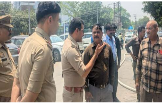
मानकों का पूर्ण अनुपालन सुनिश्चित करें। साथ ही सभी होटलों को आपातकालीन निकास द्वार (Emergency Exit) सदैव

गहन परीक्षण किया गया तथा होटल प्रबंधन एवं कर्मचारियों को अग्नि सुरक्षा के प्रति जागरूक किया गया। निरीक्षण के दौरान अग्निशमन विभाग द्वारा प्राथमिक अग्निशमन उपकरणों के उपयोग का सजीव प्रदर्शन कर प्रशिक्षण दिया गया, जिसमें लगभग 787 लोगों ने प्रतिभाग किया। इस अवसर पर उपस्थित सभी होटल संचालकों को निर्देशित किया गया कि वे अपने संस्थानों में अग्नि सुरक्षा उपकरणों को सदैव क्रियाशील अवस्था में रखें तथा फायर सेफ्टी