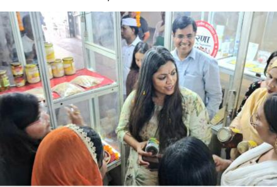
महिलाएं आत्मनिर्भर भारत के निर्माण में महत्वपूर्ण भूमिका निभा रही हैं। उन्होंने कहा कि ग्रामीण महिलाओं द्वारा तैयार किए जा रहे उत्पाद न केवल उनकी आर्थिक स्थिति को मजबूत बना रहे हैं, बल्कि उन्हें समाज में नई पहचान और सम्मान भी दिला रहे हैं। इस दौरान जिलाधिकारी ने महिलाओं का

संदीप गर्ग समाज जागरण गौतमबुद्धनगर, 04 जून। उत्तर प्रदेश राज्य ग्रामीण आजीविका मिशन (यूपीएसआरएलएम) के अंतर्गत विकास भवन में संचालित सस्स शॉप का शुभारंभ जिलाधिकारी ने फीता काटकर किया। इस अवसर पर उन्होंने स्वयं सहायता समूहों की महिलाओं द्वारा तैयार किए गए उत्पादों का अवलोकन कर उनके प्रयासों की सराहना की।