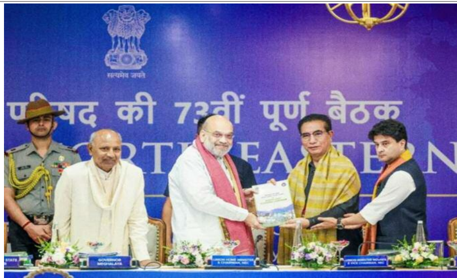
गृह मंत्री ने अग्रवुड, बांस आधारित उद्योग, वेलनेस, कॉस्मेटिक और ऑर्गेनिक उत्पादों को बढ़ावा देने के साथ-साथ जीआई टैग उत्पादों के लिए विशेष टास्क फोर्स गठित करने का सुझाव दिया।

समाज जागरण शिलांग/नई दिल्ली। केन्द्रीय गृह एवं सहकारिता मंत्री अमित शाह ने कहा है कि पूर्वोत्तर भारत आने वाले वर्षों में व्यापार, पर्यटन, डिजिटल नवाचार और निवेश का प्रमुख केंद्र बनेगा।