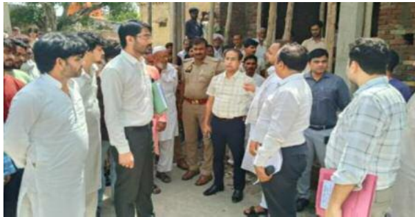
को ही अमृत सरोवर बताया गया और पिकअप गाड़ी भी बुरी तरह इंटर कॉलेज में कागजों में दिखाया गया मेन गेट और बाउंड्री वॉल भी नहीं मिली। प्रधान और सचिव ने कहा कि अभिलेख में गलती हुई है।

शिकायत की थी। जिलाधिकारी के अनुमोदन के बाद मुख्य विकास अधिकारी ने 22 अप्रैल 2026 को जांच समिति गठित की थी। समिति में जिला आबकारी अधिकारी बागपत और अधिशासी अभियंता सिंचाई विभाग बड़ौत को शामिल किया गया। समिति ने 11 जून 2026 को टांडा पहुंचकर जांच की। निरीक्षण में अभिलेखों में दर्ज अमृत सरोवर और तीन तालाब मौके पर नहीं मिले। ग्राम प्रधान और सचिव ने 2009-10 में बने पुराने तालाब