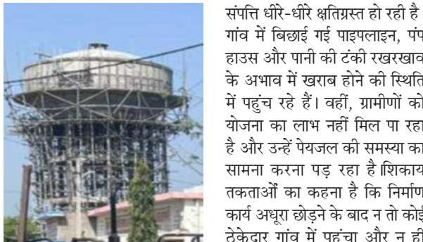
कारण करोड़ों रुपये की सरकारी संपत्ति धीरे-धीरे क्षतिग्रस्त हो रही है। गांव में बिछाई गई पाइपलाइन, पंप हाउस और पानी की टंकी रखरखाव के अभाव में खराब होने की स्थिति में पहुंच रहे हैं। वहीं, ग्रामीणों को योजना का लाभ नहीं मिल पा रहा है और उन्हें पेयजल की समस्या का सामना करना पड़ रहा है। शिकायत तकताओं का कहना है कि निर्माण कार्य अधूरा छोड़ने के बाद न तो कोई ठेकेदार गांव में पहुंचा और न ही संबंधित विभाग का कोई अधिकारी

है। ग्रामीणों का कहना है कि जल जीवन मिशन योजना के अंतर्गत गांव में पानी की टंकी, पंप हाउस और पाइपलाइन बिछाने का कार्य शुरू किया गया था, लेकिन करीब तीन वर्ष पूर्व कार्य अधूरा छोड़ दिया गया। इसके बाद कई बार ग्राम प्रधान और ग्रामीणों द्वारा संबंधित विभागीय अधिकारियों को शिकायत पत्र दिए गए, लेकिन अब तक कोई कार्रवाई नहीं हुई। ग्रामीणों ने आरोप लगाया कि अधूरा निर्माण कार्य होने के