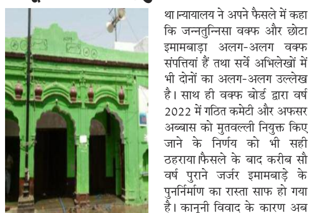
वाली मरिजद को जन्तुनिस्सा वक्फ का हिस्सा बताते हुए मुतवल्ली पद पर अपने परिवार का अधिकार होने का दावा किया था। ट्रिब्यूनल ने उनके दावों को खारिज कर दिया