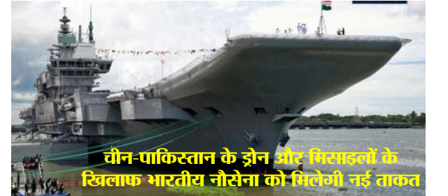
तीन-पाकिस्तान के ड्रोन और मिसाइलों के खिलाफ भारतीय नौसेना को मिलेगी नई ताकत

नई दिल्ली, समाज जागरण। आधुनिक युद्ध में जहां मिसाइलों और टैंकों के साथ-साथ इलेक्ट्रॉनिक युद्ध की भूमिका लगातार बढ़ रही है, वहीं भारत ने इस दिशा में एक बड़ा कदम उठाया है। भारतीय नौसेना ने लगभग 449 करोड़ रुपये की लागत से 20 अत्याधुनिक रोलबल नेविगेशन सैटेलाइट सिस्टम जैमर हासिल करने की प्रक्रिया को मंजूरी दी है। रक्षा विशेषज्ञ इसे भविष्य के युद्धों में गेमचेंजर तकनीक मान रहे हैं।