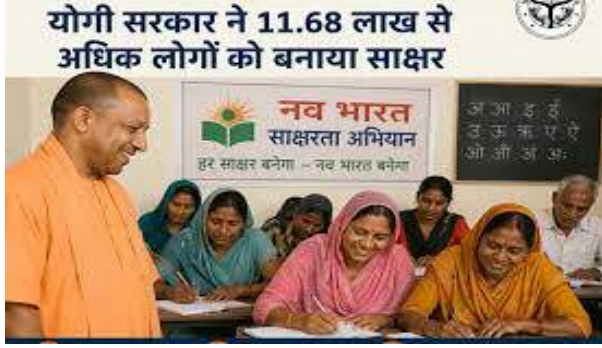
लोगों तक पहुंच बनाई जा सके।

अभियान के तहत पहले असाक्षर व्यक्तियों की पहचान की जाती है। इसके बाद प्रशिक्षित मास्टर ट्रेनर्स और वालंटियर्स द्वारा गांवों, कस्बों और शहरी क्षेत्रों में साक्षरता कक्षाओं का संचालन किया जाता है। ऑनलाइन और ऑफलाइन दोनों माध्यमों से शिक्षण व्यवस्था सुनिश्चित की गई है, जिससे अधिक से अधिक