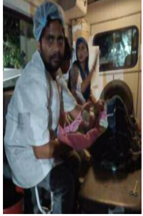
वाइटल चेक किए महिला की हालत