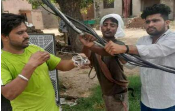
कार विद्युत विभाग ने संज्ञान लेते हुए जर्जर तारों का नवीनीकरण कर

कस्बे के मोहल्ला खेल में लंबे समय से जर्जर विद्युत लाइन के कारण स्थानीय लोगों को भारी परेशानी का सामना करना पड़ रहा था। पुराने और क्षतिग्रस्त तारों में आए दिन स्पार्किंग होने के साथ-साथ आग लगने की घटनाएं भी सामने आ रही थीं। इससे क्षेत्र के लोगों में हर समय किसी बड़े हादसे की आशंका बनी रहती थी। लगातार शिकायतों के बाद आखिर