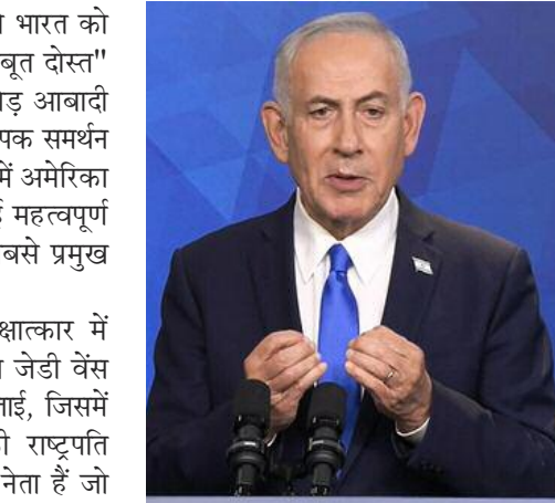
'कई देश निजी तौर पर भी करते हैं समर्थन'

नेतन्याहू ने कहा, "हमारे कुछ और दोस्त भी हैं, जैसे भारत। 140 करोड़ आबादी वाले इस देश से हमें जबरदस्त समर्थन मिलता है।" उन्होंने यह भी बताया कि उनके आधिकारिक फेसबुक पेज पर भारतीय नागरिकों की ओर से लगातार बड़ी संख्या में समर्थन और सकारात्मक प्रतिक्रियाएँ मिलती हैं।