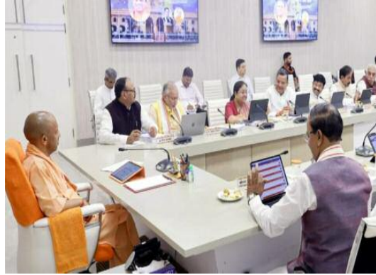
वैश्विक नेतृत्व दिलाने का सपना साकार होने की दिशा में महत्वपूर्ण कदम बढ़ा है।