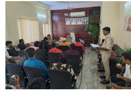
हूए शिविरों में लगे विद्युत उपकरणों की सुरक्षा सुनिश्चित करने, शॉर्ट सर्किट से बचाव के उपाय करने तथा प्रत्येक शिविर में आपातकालीन मेडिकल किट उपलब्ध रखने के